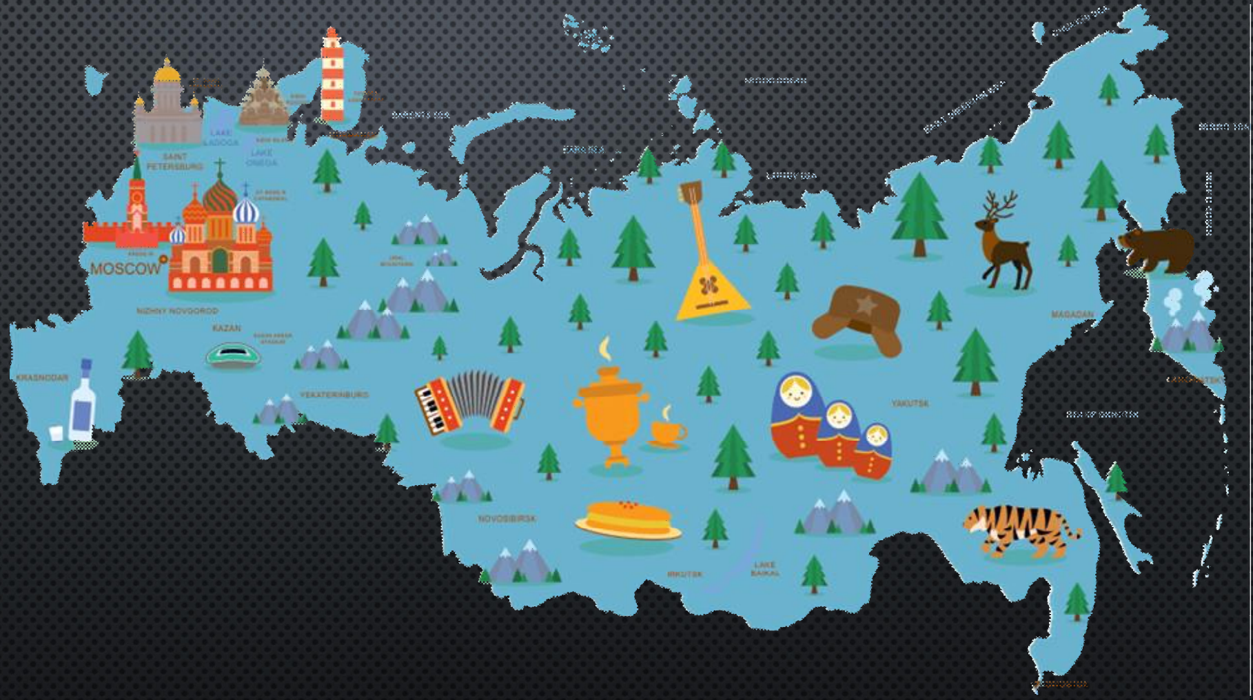
Рис. 1. Территория традиционной русской культуры.